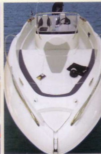
635 Commander. Une baffle à mouillage bien placée est fournie d'origine pour faciliter les opérations d'ancre.