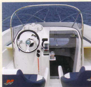
635 Commander. Élégance et allure sportive pour cette console de belle conception.

Tableau complet des spécifications et équipements en page 38