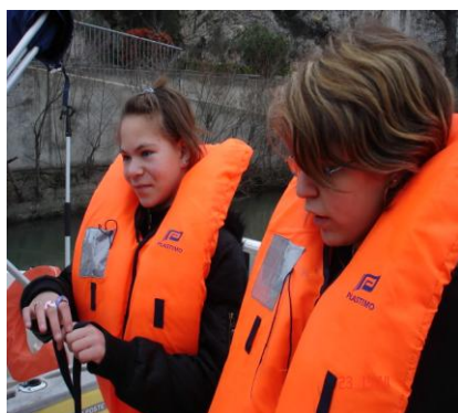
Le gilet de sauvetage

Axes de travail de : compréhension, concentration, repérage et mémorisation.