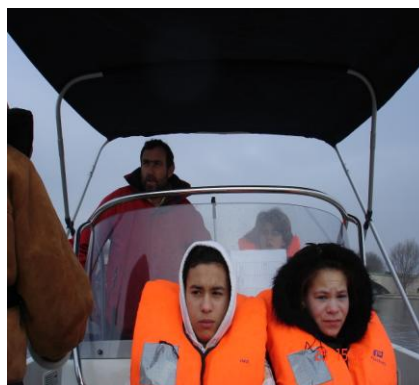
Le taud (toit de toile)