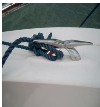
Sur le bateau