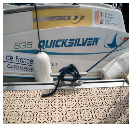
Sur le ponton